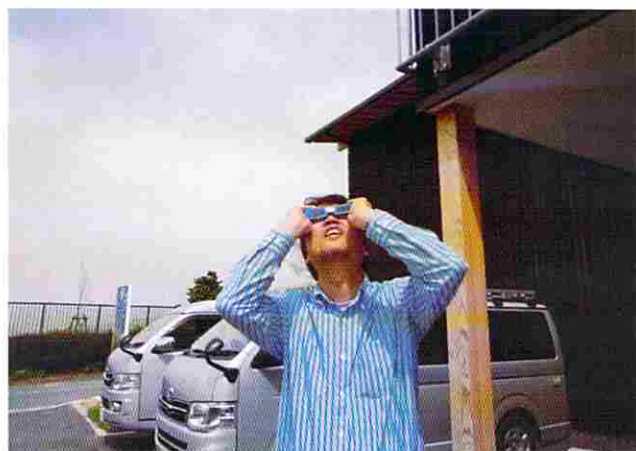
写真1 日食メガネは必ず両手でもって見よう。不意に外れると直射日光が目に入って危険である。

では1時間以上の長い時間がある。この時間、ずっと日食メガネで観察していると目が疲れるだけでなく、誤って直射日光が目に入る危険性も高くなる。そこでおすすめなのが、木漏れ日の観察だ。白い紙を持って、大きく欠けた日食の太陽が作る木漏れ日を見てみよう。日食観察の一番の楽しみが木漏れ日観察と言っても過言はないだろう。