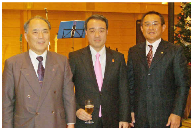
村上ガバナーと共に