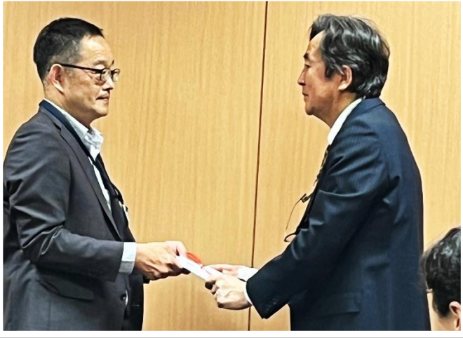
手作業で募金額を計算しました。