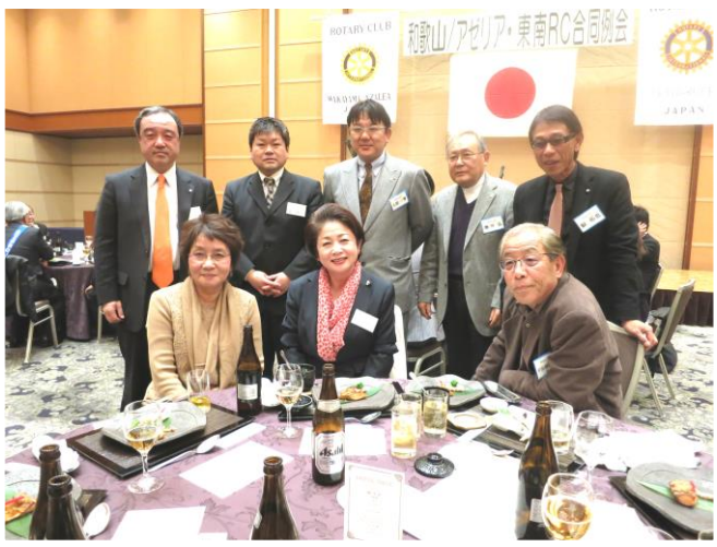
最後は「手に手つないで」